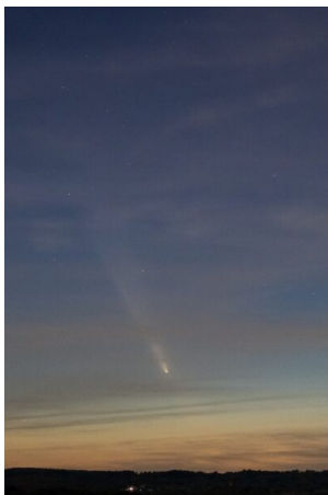
Michaël BELLEVILLE - Canon 2000D - 35mm - F2.8 - ISO 1000 - Pose de 6s