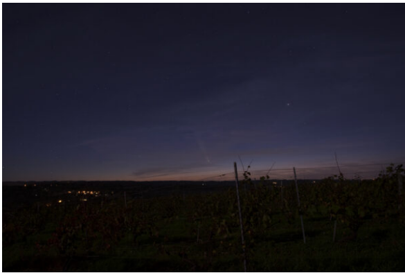
Sans doute la plus belle photo nocturne de poteau... Pentax K1 mkII - 24 mm - 8 sec. - f:4,5 - ISO 1600