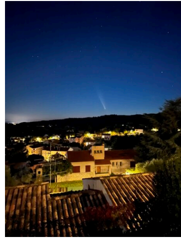
François FARRUGGIA - iPhone 13 - 26 mm - 1 sec. - ISO 3200. Quand un adhérent s'exile sous le ciel plus propice du sud de la France...