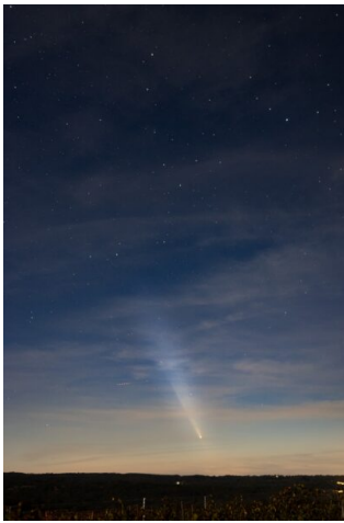
Flora CHARBONNEAU - Canon 90 D - Objectif 24 mm, f1.4. - 1 x 8s à ISO 400